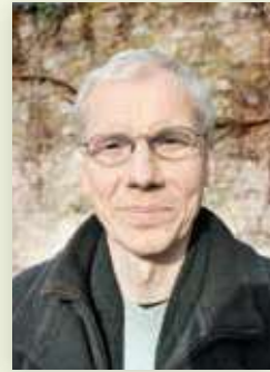
Berthold Stadion, Geinsheim